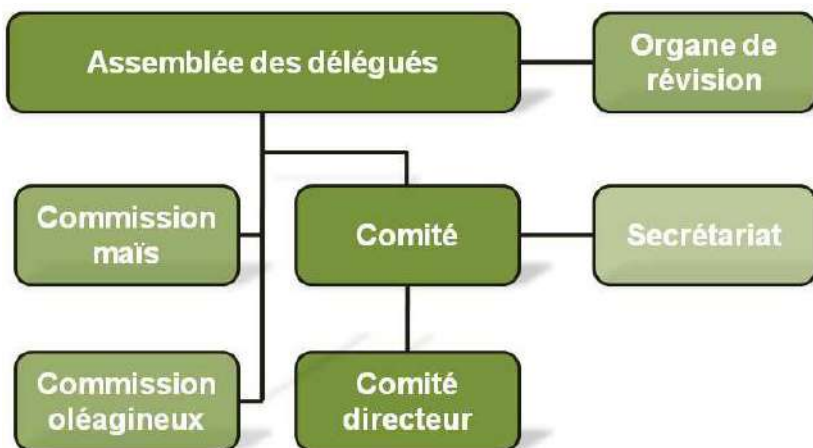
Organigramme de la FSPC

La fédération suisse des producteurs de céréales (FSPC) est l'organisation nationale des producteurs de céréales, d'oléagineux et de protéagineux. La FSPC représente les intérêts des producteurs. Elle s'engage pour des conditions-cadre favorables, pour une production orientée vers le marché, ainsi que pour la promotion de la qualité et l'acquisition de nouveaux débouchés.