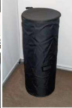
Masse Transport - Container ø 35 cm / Höhe 87 cm

Höhe: 223,5 cm, Durchmesser : 65 cm Gewicht : 15 kg; Transport : Auto